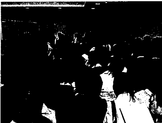
(関東甲信越ブロック学会ポスター会場)

日常的に病院にいと、病院の中での出来事に目が向きがちですが、今回のように外部に対して視野を広げた動きに取り組む機会をもつことも大いに意義があるのではないかと考えます。