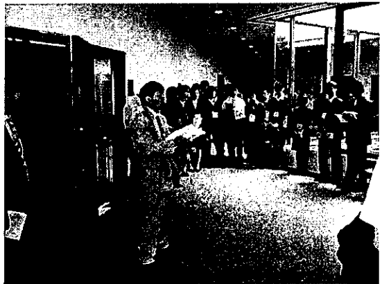
(運営スタッフのミーティング風景)

当日は、恒例の天気には振りまわされる一幕もありましたが、各会場責任者の先生や運営委員として参加して頂いた先生方・学生の皆様の奮闘により、無事学会運営を行う事ができました。ほとんど、ボランティア状態にも関わらずご協力を頂いた先生方に、紙面をお借りして御礼申し上げます。関ブロ学会は10年位に1度担当がまわってきます。次回は、あなたが会場運営に携わることになるかもしれませんよ。