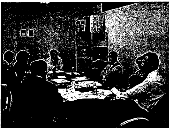
※新事務所での理事会風景

千葉県理学療法士会 事務局 千葉中央コミュニティーセンターB1、 千葉市中央区千葉港2-1 Tel 043-238-7570